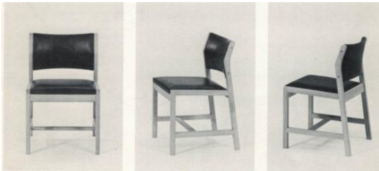
BM 72 stol med polstret sæde og ryg stuhl – stuhlsitz und stuhllehne mit stoff oder leder chair – seat and back with fabric or leather 51 x 53 cm – sædehøjde 44 cm – totalhøjde 76 cm