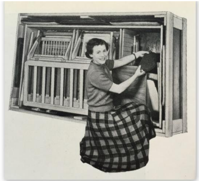
Fig. 11. For at gøre transporten enkel og billig, blev stolene lavet med forskellige beslag, så de kunne skilles ad og atter samles efter ankomsten. Billedet viser "saksestolen" som to-personers sofa (ses i profil på fig. 10) adskilt i sine hovedkomponenter klar til forsendelse.

Samarbejdet kom i gang under navnet JUTEX A.m.b.a. med Hovmand-Olsen som omdrejningspunkt. MCM blev formand for bestyrelsen og skulle forsøge at holde sammen på tropperne. Det var, med en sprælsk og kreativ arkitekt uden den fornødne forretningsdisciplin på den ene side og jordnære fabrikanter på den anden side, ikke problemfrit. Så det gav mange ærgrelser - og krævede meget tid for at få snakket tingene på plads og få det til at glide.