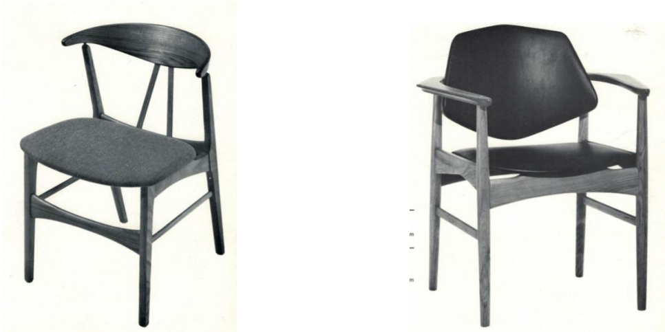
Fig. 16. Stol nr. 25 og stol nr. 40 tegnet af Poul Christensen. Begge solgte godt i flere år - hovedsagelig til Guildhall Cooperation og Scannart Shipping.

Men den danske træart bøg anvendtes kun til de dele, som skulle polstres.