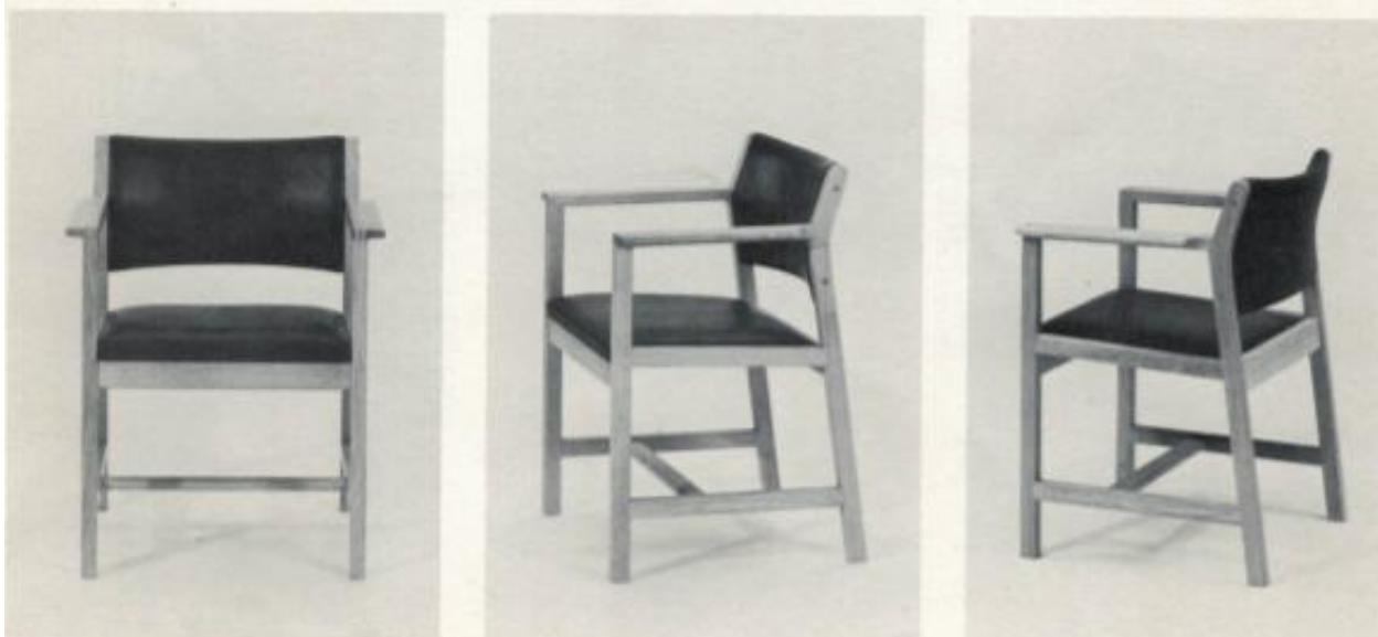
BM 73 armstol med polstret sæde og ryg armstuhl – stuhlsitz und stuhllehne mit stoff oder leder