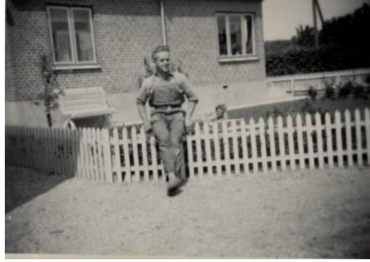
Fig. 3. MCM foran beboelsen, som lå nord for fabrikken ud mod Kærvej. Også her aner man de nyplantede espaliertræer. De gav i mange år attraktive pærer og blommer.

kommandant (major), som boede på Onsild Hotel (med en dansk kvinde) ønskede møbler fremstillet til sig selv og derfor lod forskellige snedkeruddannede soldater anvende værkstedet.