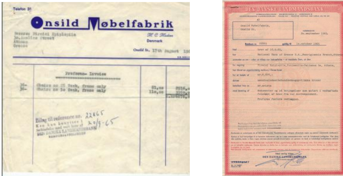
Fig 14. Ved direkte eksportsalg foregik handelen oftest per remburs, hvilket indebar, at OM umiddelbart efter afskibning kunne hæve pengene i banken mod at fremvise de i rembursen foreskrevne afskibningsdokumenter, som garanterede køber, at varerne levende op til de aftalte konditioner.