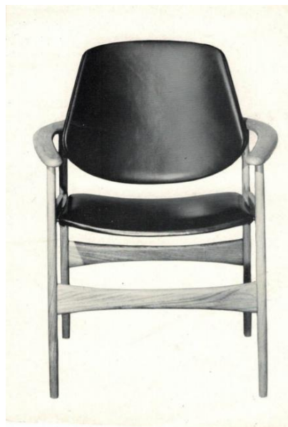
Fig. 13. De to bedst sælgende modeller tegnet af Hovmand-Olsen for JUTEX og fremstillet af OM. Begge fremstillet i siam-teak og konstrueret, så de ubesværet kunne skilles ad og sendes i kompakte kartoner, uden at de led overlaster.

JUTEX gav OM en række år, hvor omsætningen steg betydeligt. Imidlertid udnyttede JUTEX i MCM's øjne ikke de forretningsmæssige muligheder, der faktisk forelå. OM begyndte derfor i 1960-ernes begyndelse at se sig om efter andre samarbejdspartnere og lod samarbejdet med Hovmand-Olsen langsomt glide i baggrunden. Efter nogle år afgang det ved en stille død. Det vedblev dog at ærgre MCM, at JUTEX ikke havde udviklet sig til noget mere. Både MCM og RM ville gerne set en større ekspansion.