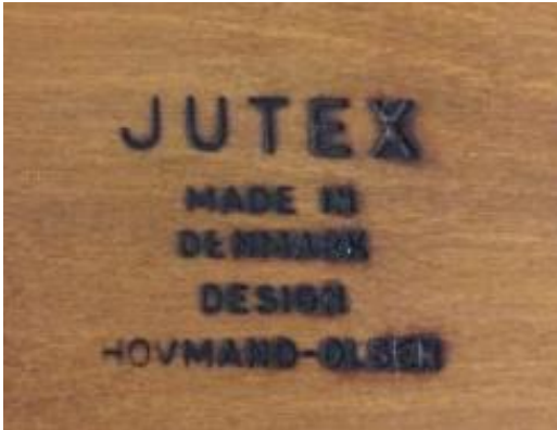
Fig. 12 Alle stole fra OM blev brændemærket under stolesædet. Udover JUTEX fremgik også, at det var made in Danmark og at arkitekten var Hovmand-Olsen.