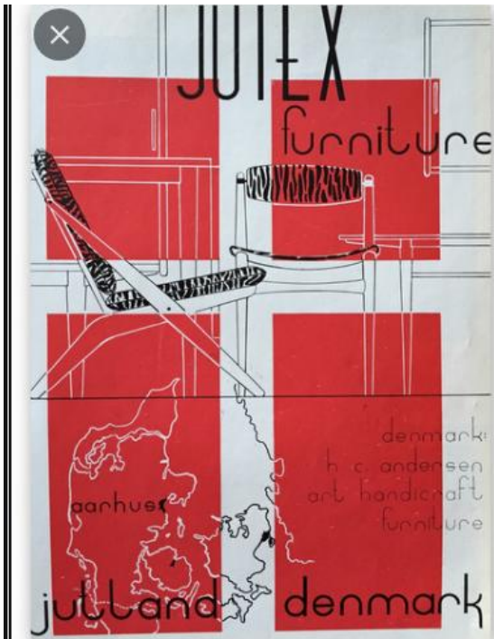
Fig. 10 På alle forsendelse (se fig. 11) blev der påsat ovenstående etiket, som klart signalerede den danske oprindelse. Desuden ser man en stiliseret udgave af nogle af de valgte møbler - bl.a. saksestolen De to stole blev begge produceret på OM.'