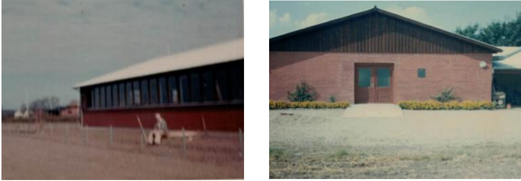
Fig.22. Det nye værksted set fra vest og syd. Som det ses, blev der stadigvæk plantet espalier på de velegnede steder.