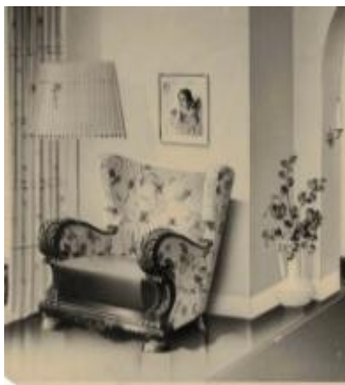
Bilag 1. Eksempler på møbler fremstillet af Onsild Møbelfabrik i perioden 1930-50.