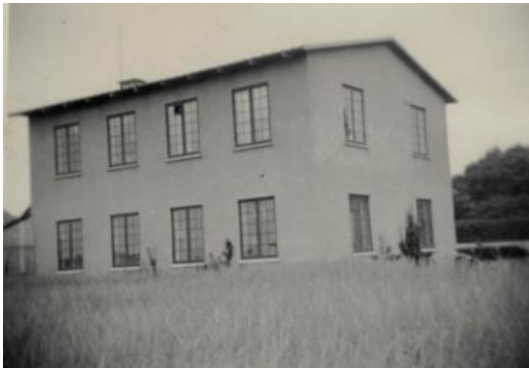
Fig 2. Den første fabriksbygning fra 1936 Det var karakteristisk, at der blev plantet frugttræer (æbler, pærer, blommer og kirsebær) som espaliertræer ved alle vest- og sydvendte facader. Der indgik altid store mængde frugt i husholdningen..