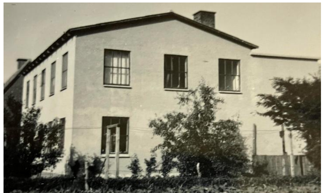
Fig. 9. Tilbygningen fra 1954 set NV og V. Den var sammenbygget med den første fabriksbygning, som den lå NØ for.